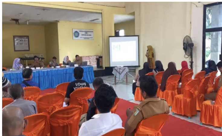
Gambar 2. Kegiatan Penyuluhan dan Sosialisasi Teknologi Tabulampot

Kegiatan penyuluhan dilakukan dengan metode ceramah dan diskusi interaktif mengenai pentingnya pemanfaatan pekarangan rumah untuk mendukung ketahanan pangan keluarga. Materi yang diberikan meliputi konsep tabulampot, manfaat budidaya jambu biji dalam pot, pemilihan bibit unggul, penyusunan media tanam, pemupukan, pemangkasan, serta pengendalian hama dan penyakit.