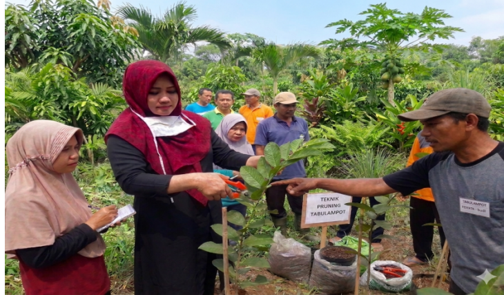
Gambar 3. Pelatihan dan Demonstrasi teknik budidaya tabulampot jambu biji

hingga teknik pemeliharaan tanaman. Kegiatan ini bertujuan meningkatkan keterampilan peserta dalam menerapkan teknologi yang telah disosialisasikan.