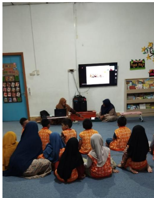
Gambar 3. Demonstrasi praktik melihat gambar dan video menggunakan TV digital

Kegiatan mengupas kunyit dan jahe serta menyiram tanaman tersebut dapat mengembangkan kemampuan motorik halus anak. Sebagaimana yang telah dijelaskan oleh penelitian (Sanenek et al. , 2023) bahwa pengembangan kemampuan motorik halus dilakukan dengan memperhatikan strategi kemampuan hidup dari Montessori, memperhatikan fleksibilitas media, memilih metode yang dapat melibatkan anak secara langsung, mengamati perkembangan anak secara individu dan kelompok, dan dukungan dari orang dewasa. Kegiatan bermain peran seperti menjadi petani kunyit dan jahe dapat melatih kemampuan sosial emosional anak. Hal tersebut berdasarkan penelitian (Musthofiyyah et al. , 2025) bahwa metode bermain peran berkontribusi positif pada perkembangan sosial emosional anak, ditandai dengan kemampuan bermain kooperatif, memahami karakter, dan mengikuti alur permainan sesuai peran. Metode ini efektif untuk membantu anak memahami kemampuan bekerja sama, mengelola emosi, menunjukkan empati, dan berkomunikasi.