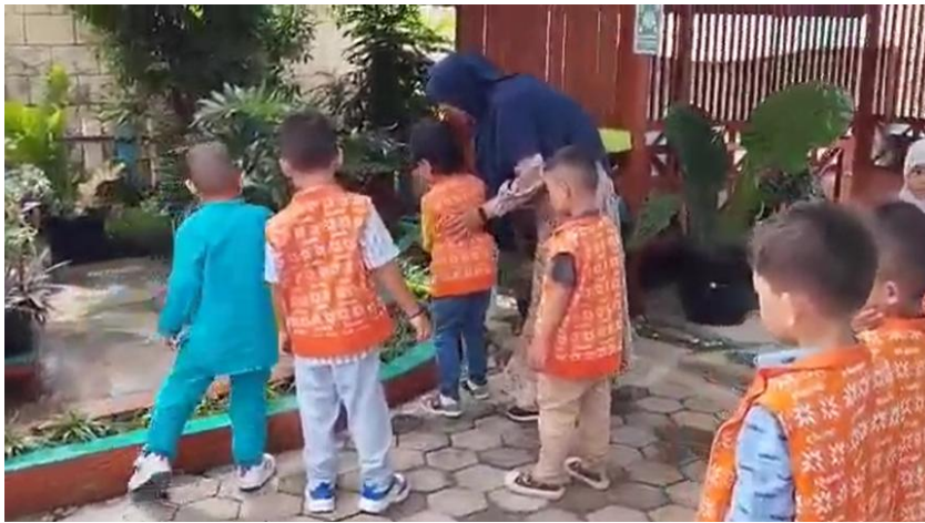
Gambar 4. Kegiatan menyiram tanaman

Pelaksanaan pendekatan ilmiah berupaya membangun suasana yang menyenangkan untuk menarik minat anak-anak. Pendekatan ilmiah mampu membangun kreativitas, imajinasi dan ide yang mengembangkan nilai-nilai agama dan moralitas, motorik, kognitif, bahasa, sosial, emosional dan seni berdasarkan pada prinsip-prinsip perkembangan anak. Oleh karena itu, pelaksanaan pendekatan ilmiah dalam proses pembelajaran pendidikan anak usia dini dapat mengasah kecerdasan spiritual dan intelektual anak-anak ( Munastiwi, 2015 ).